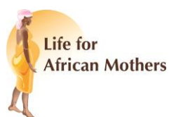
Life for African Mothers